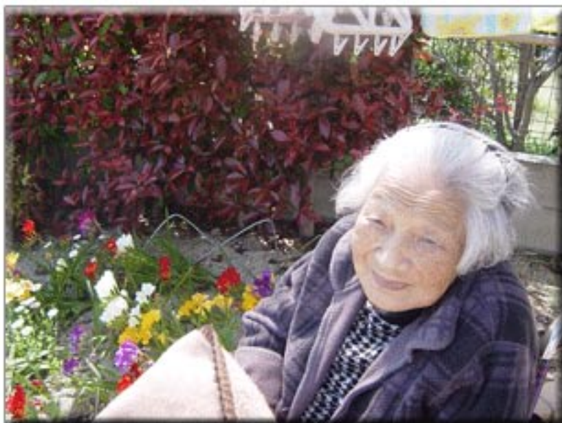
綺麗なお花をバックに、パチリ！