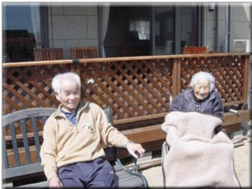
お天気のいい日は、お外で日向まっこ。 気持ちいいですね♪