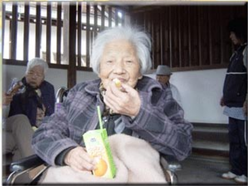
美味しいおやつとジュースを持っていきました。 お外で食べるおやつは格別ですね！

皆さんこんにちは。 だんだん日差しが強くなってきて、紫外線が気になる今日この頃。いかがお過ごしでしょうか？ さて、やすらぎホーム金光では先日、道通神社へドライブに行ってきました。