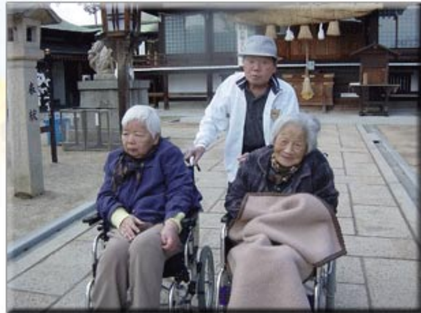
皆で記念撮影もしました。ついでにお参りもしましたね。