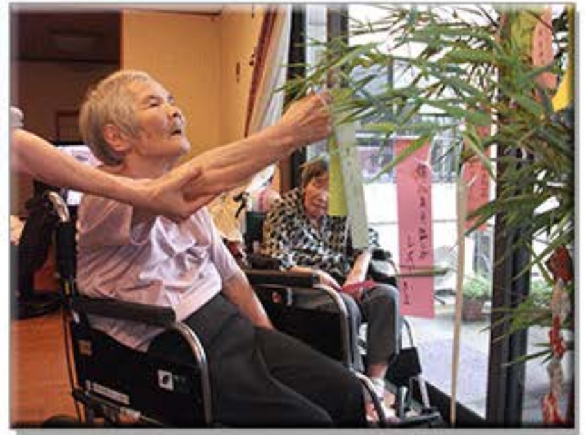
みなさん短冊にお願いすることは、やはり?! 「いつまでも健康で長生きできますように！」 でしょうか。