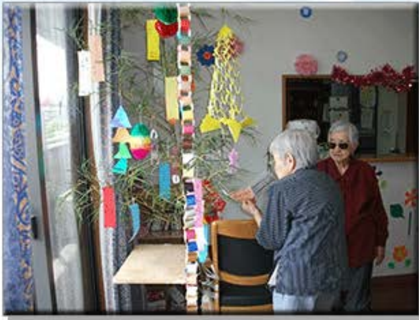
七夕飾りをより綺麗にしようと、 みなさん真剣です。

今回は、7月5日2階、9日1階、に行われた七夕祭りと、 8月9日に行われた夏祭りの様子をお伝えいたします。