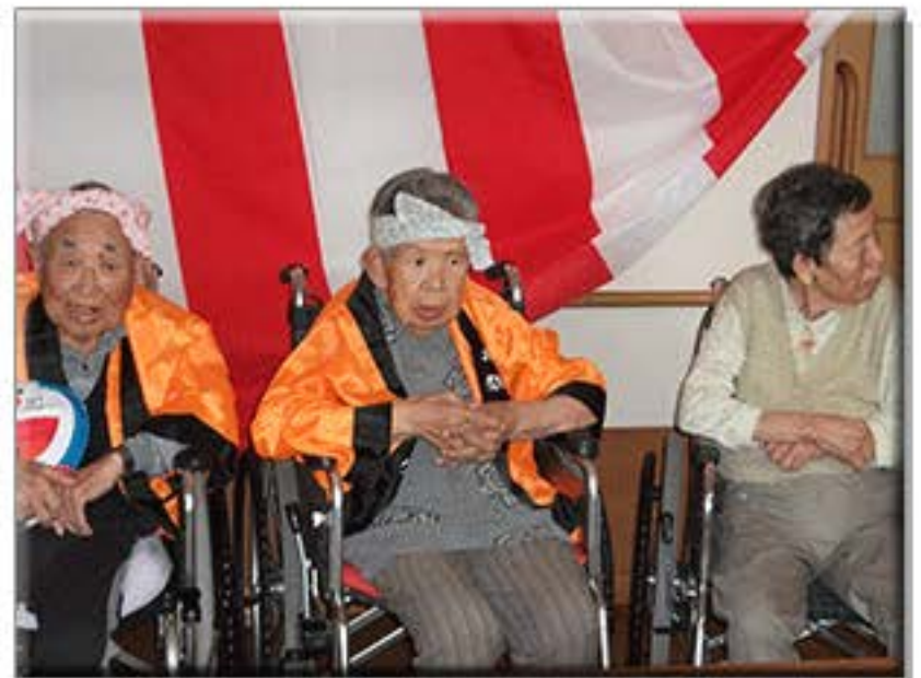
締めくくりにお祭り大成功で、 みなさんとてもご満悦な表情を 1枚写真に残させていただきました。