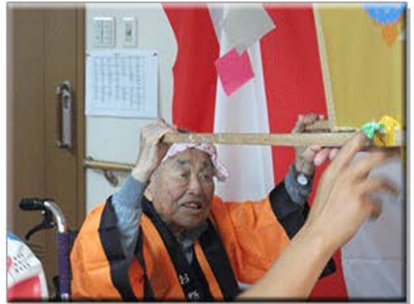
8月9日、やすらぎホーム金光 夏祭りを 盛大に行いました。 今回お神輿を用意させて頂きまして お祭りらしさを演出してみました。