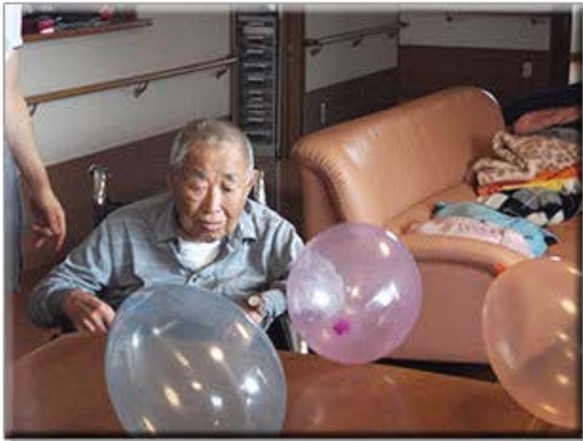
風船を使って連想ゲームやしりとりをやって その日を楽しくすごしました。